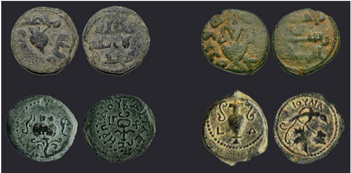
Рис.2 Гранат и амфора на монетах Омейядского халифата VII-VIII веков (верхний ряд) и на иудейских монетах, соответственно, Ирода Великого, I век до н.э. и Валерия Грата, I век н.э. (нижний ряд)

Изображения еврейской меноры украшают мусульманские монеты, датируемые периодом Омейядского халифата (VII-VIII века н.э.). Эти очень редкие монеты достоинства «фельс» найдены в ходе различных археологических раскопок в Израиле.