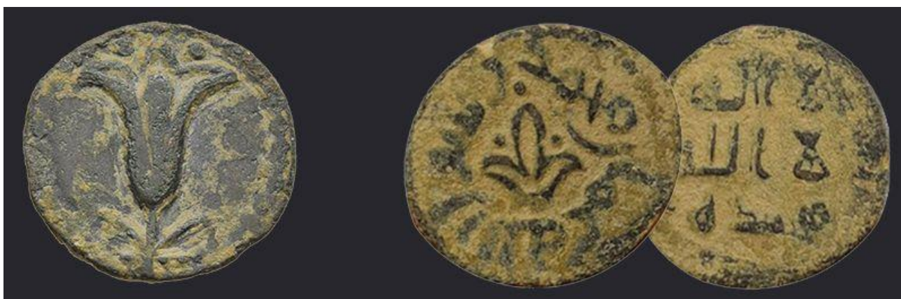
Рис.1 В VII веке знакомая по иудейским монетам лилия перекочевала на бронзовый фельс Омейядского халифата (справа), имевший хождение на территории Сирии и современного Израиля.

Почему символы одной религии нередко оказываются на монетах государств с совершенно другой религиозной направленностью?